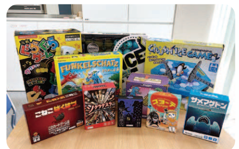
各種ボードゲーム