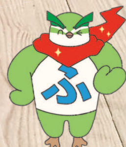
公式マスコットキャラクター 「ふくしさん」

ボッチャとは、白い目標球に赤と青のボールをいかに近づけられるかを競う、ヨーロッパ発祥のパラリンピック正式種目です