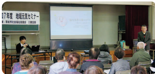
地域元気セミナー（社協三妻支部）

今年度も7月1日～31日の期間で赤い羽根地域づくり応援助成金の申請受付を行い、事業経費の一部を助成します。助成対象となる事業や助成額など、詳しくはお問い合わせください。