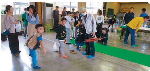
三世代交流会（杉山自治区）