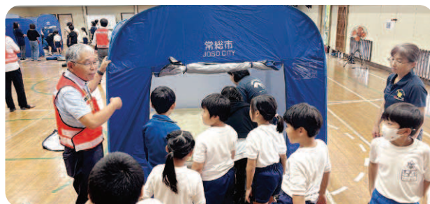
小学生への防災学習（社協豊田支部）