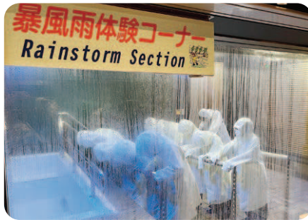
夏休み親子防災教室