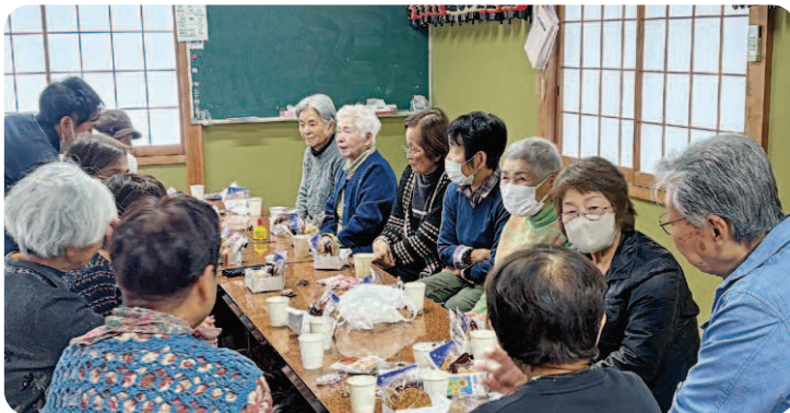
サロン・ド・サカエ（水海道栄町）

住民の皆さんが、自分たちで内容を決めて運営する気軽な交流の場です。社協が支援する市内 30 か所のサロンでは、お茶飲みや食事会、簡単なゲームや体操などを行っています。交流を通じて生きがいや地域の絆が生まれ、リフレッシュできると大好評！ぜひあなたもお近くのサロンへ参加してみませんか！