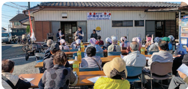
福祉まつり（社協水海道山田町支部）