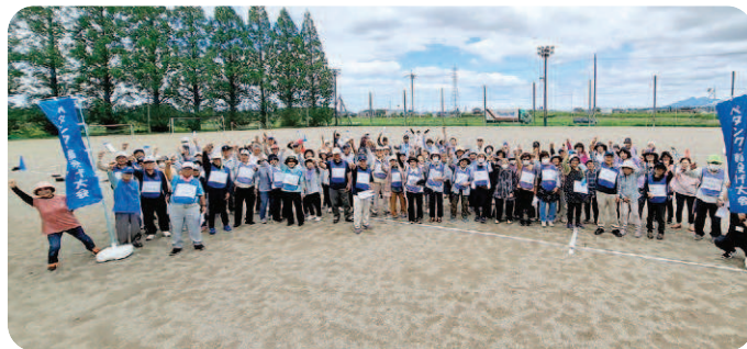
勝利を競う大勢の参加者