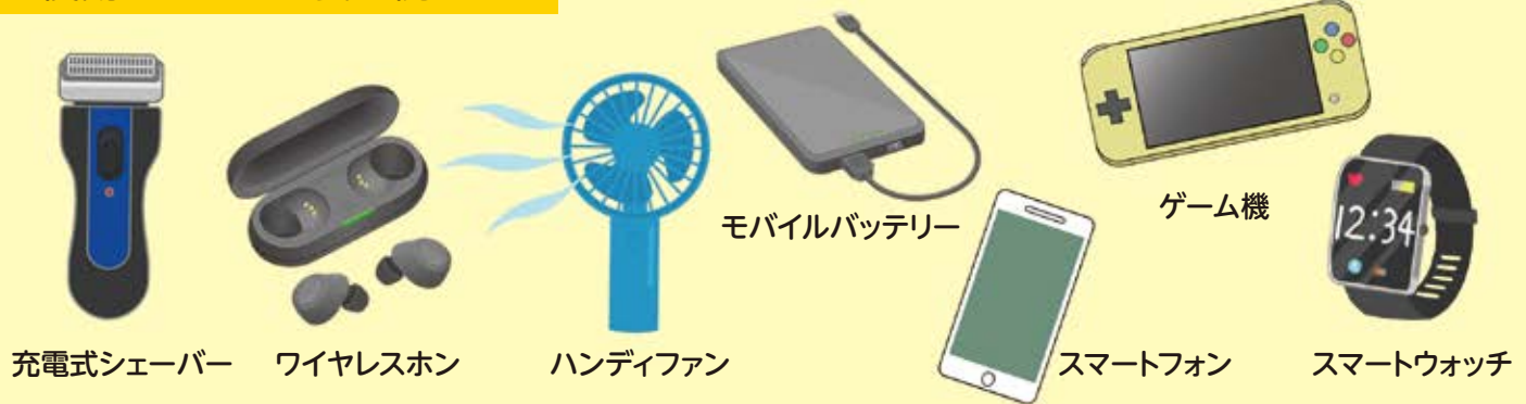
充電式シェーバー