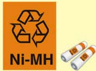
ニッケル水素電池