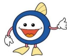
下水道マスコットキャラクター 「スイスイ」