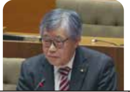
堀越 道男 議員