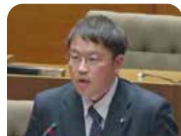
入江 越史 議員

発達に遅れのある、特性をもつ子どもが地域の中で当たり前に育つことができる環境づくり、支援体制の具現化を改めてお願いする。