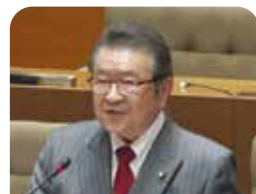
倉持 守 議員