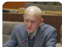
岡野 一男 議員