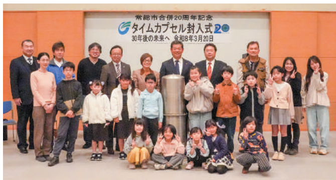
タイムカプセル封入式に参加した皆さん

市合併20周年を記念し、3月20日、石下総合福祉センターにおいてタイムカプセル封入式を開催しました。