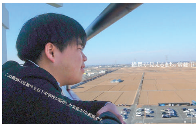
完成した市のPR動画