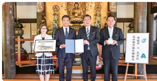
(左から)中中市議会議員、神達市長、成澤文京区長、市村文京区議会議員

します。相互誘客により関係人口の拡大を目指すとともに、地域の魅力や課題を共有し、互いに学び、支え合う関係の構築を目指していきます。