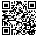
地方税お支払サイト