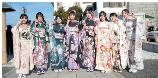
華やかな晴れ着姿の皆さん

1月10日、地域交流センターにおいて「2026はたちのつどい」を開催しました。20年前の1月に常総市となった本市と同じ20年を歩んできた651人が20歳を迎え、式典には419人が参加し、新たな門出を祝いました。