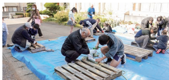
地域の方と一緒に竹あかり作りをする児童

昨年11月7日に、五箇小学校で地域の方々と児童・保護者が一緒になって楽しむ「五箇の心をつなぐ、なかよしプロジェクト」を開催しました。当日は、多くの地元の方々と児童が交流しながら、紙すき体験や金魚釣り竿作り、竹あかり作りなど多彩な体験をしました。担当者は「地域に伝わる技や知恵を子どもたちに伝え、ふるさとの魅力や地域の温かさを感じてもらうことができました」と話していました。