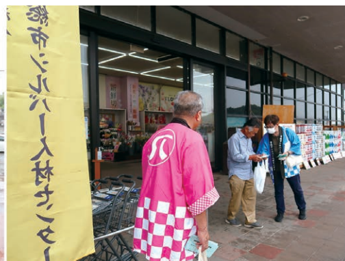
ホームジョイ本田石下店