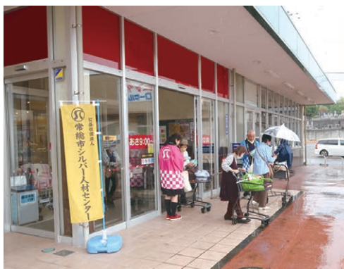
カスミ水海道栄町店