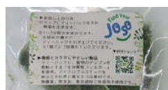
商品パッケージに使用