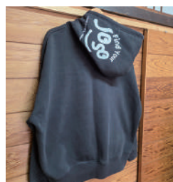
商品デザインに使用