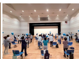
健康運動指導士の体操