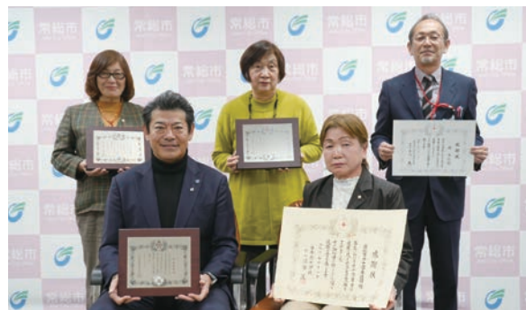
表彰された皆さん