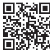
異常通報システム