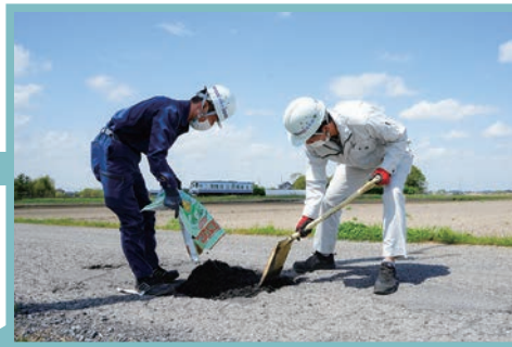
軽度の破損の場合は、補修材を破損した箇所に敷き詰めます。