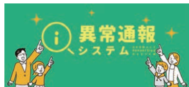
ホームページの特設バナー