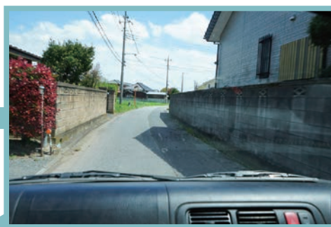
道中も道路の状況に目を光らせます。