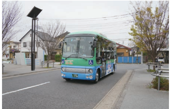
市内を運行する「JOYBUS」の車両