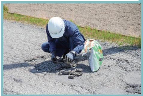
破損の状況を確認します。