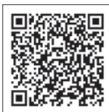
国民健康保険税の詳細および納期限についてはこちら