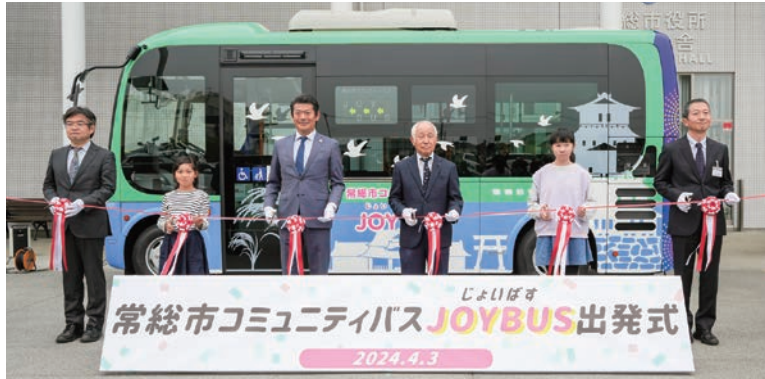
出発式でテープカットする関係者の皆さん

コミュニティバスは年末年始（12月29日～1月3日）を除き、毎日運行しています。市街地への買物や通院のほか、鉄道駅への乗り継ぎも可能ですので、ぜひご利用ください。