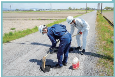
敷き詰めた補修材を圧力を加えて固めます。