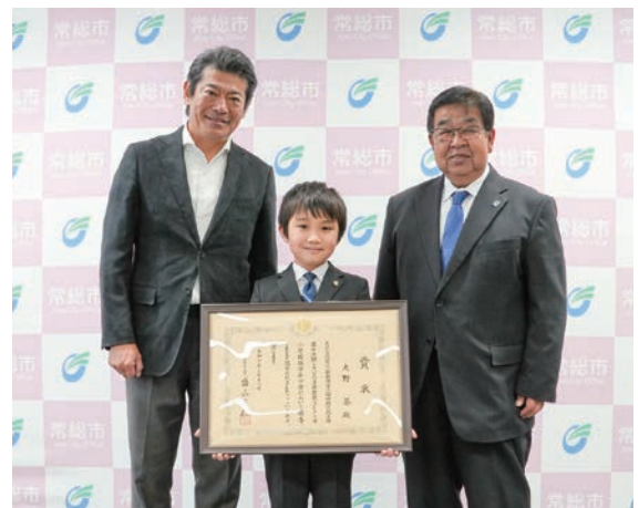
神達市長を表敬訪問した大野さん(中央)