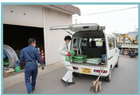
必要な資材を車に積みます。