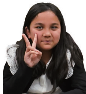
ガラゲカルナラトナ じゃすみんさん

本人は絵を描くことが好きなので、内緒で応募しました。ヒーローを描くときに意見がぶつかることもありましたが、それがまた面白く、親子で良い思い出になりました。