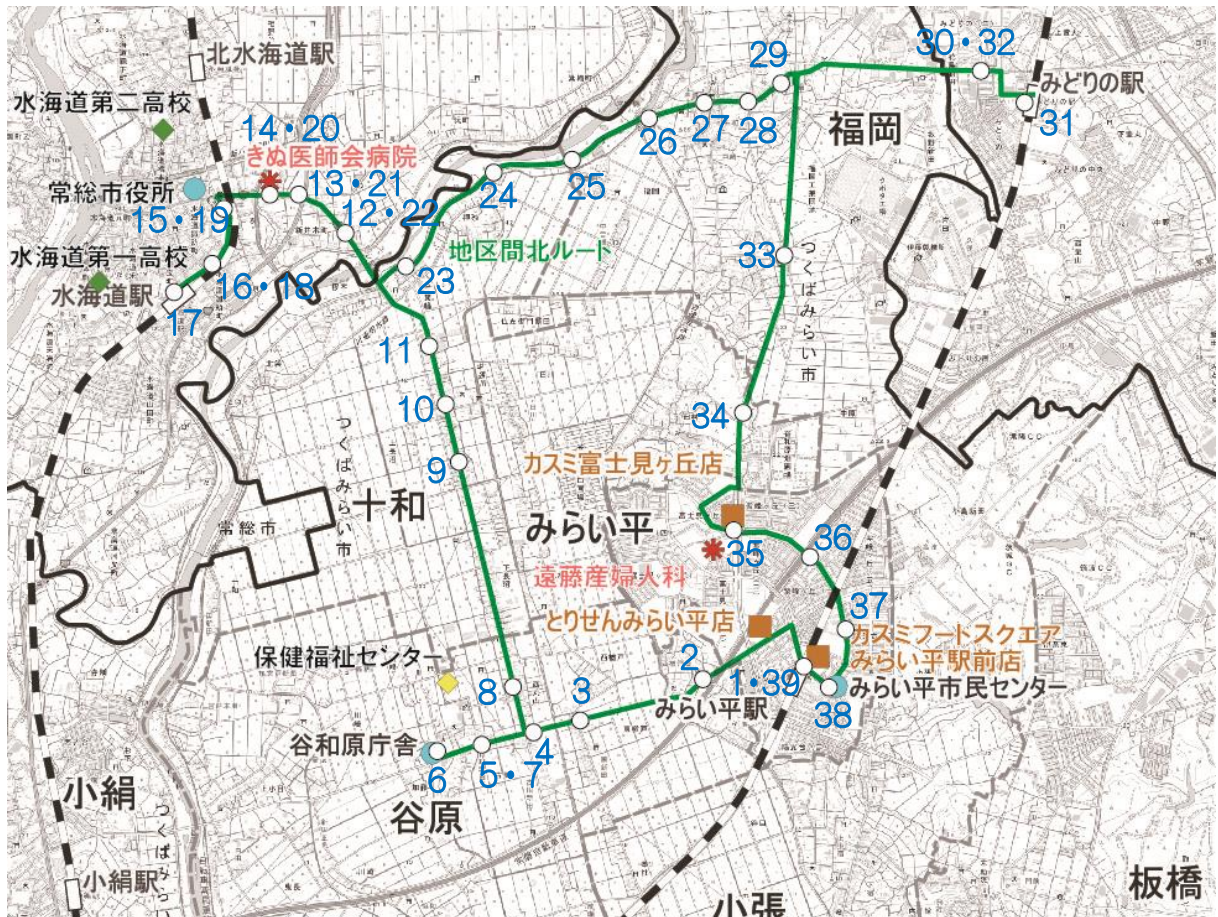
<きぬ医師会病院・みらい平駅ルート拡大図>