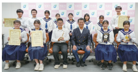
水海道中吹奏楽部の皆さん