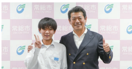
水海道西中宇賀地さん(左)