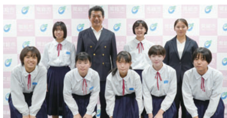
水海道西中女子剣道部の皆さん