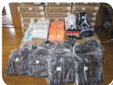
整備された発電機やエコダンベッドなどの備品