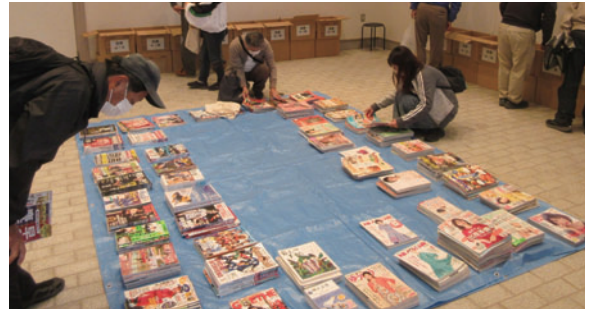
参加者が本を選んでいる様子

あいにくの空模様となった2日間でしたが、読書の秋ということで多くの方が来場し、お目当ての本を探していました。