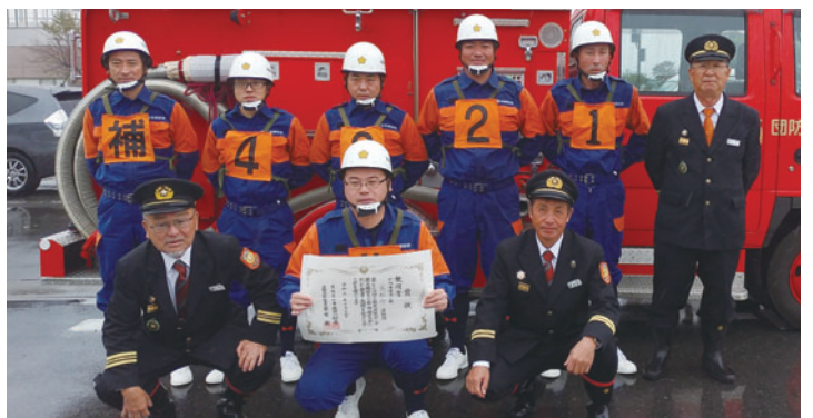
雨の中健闘した選手の皆さん

常総市消防団を代表して6人の選手が出場。大会当日は、雨が降りしきる悪天候となりましたが、日頃の訓練の成果を発揮し、健闘しました。