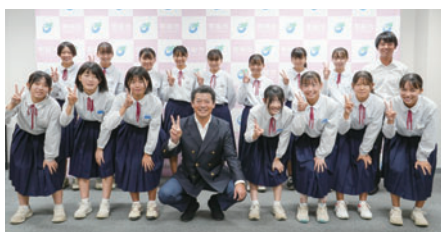
水海道西中女子ハンドボール部の皆さん