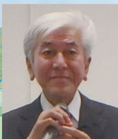
講師の秋田事務局長

40人の市民の方が参加し、地球温暖化のメカニズムやこれからの温暖化の方向、また自分自身でできるエコ活動、熱中症対策について学んでいました。参加者からは「身近な課題である温暖化や熱中症について、分かりやすく学ぶことができた」などの声がありました。