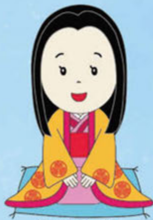
常総市マスコット キャラクター 千姫ちゃま