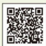
認知症サポーター

※介護サービス利用には、幸せ長寿課または石下庁舎暮らしの窓口課で、介護保険の認定申請の手続きが必要です。