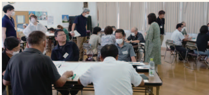
菅生・大塚戸地区