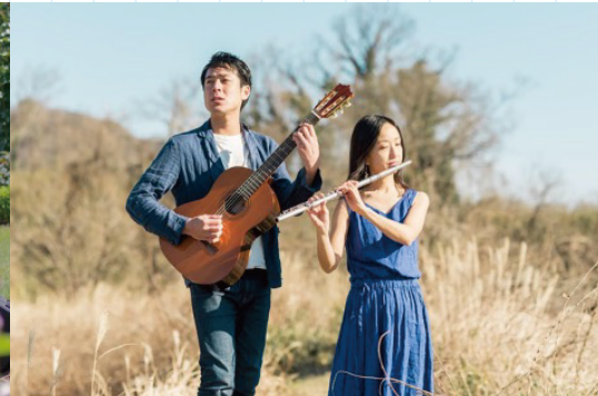
arbol (Guitar & Flute)