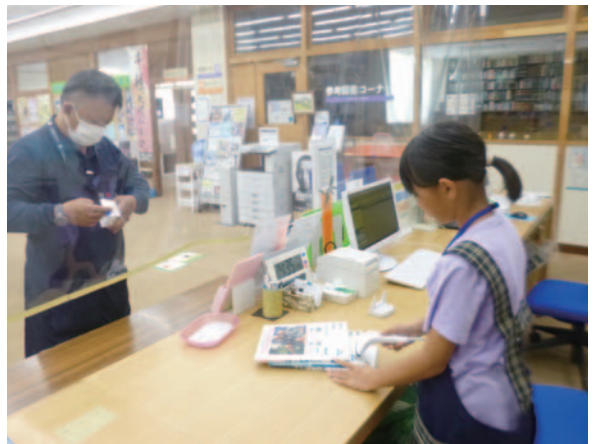
本の貸出体験をする児童

担当者は「参加者には貴重な体験になったかと思います。皆様のご協力に感謝申し上げます。また、次回のご参加をお待ちしています」と話していました。