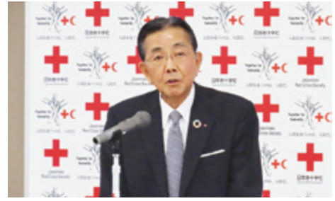
〈挨拶する寺門支部長〉

会議では、各施設における令和4年度の事業報告及び収支決算報告について審議し、全議案とも原案どおり承認されました。