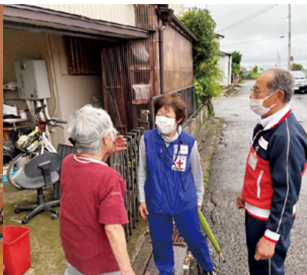
〈被災地区を巡回する赤十字ボランティア〉

6月2日夜から3日未明にかけて発生した台風第2号や梅雨前線の影響による大雨で、取手市双葉地区を中心に約600の世帯が浸水被害に見舞われ、同市に「災害救助法」が適用されました。