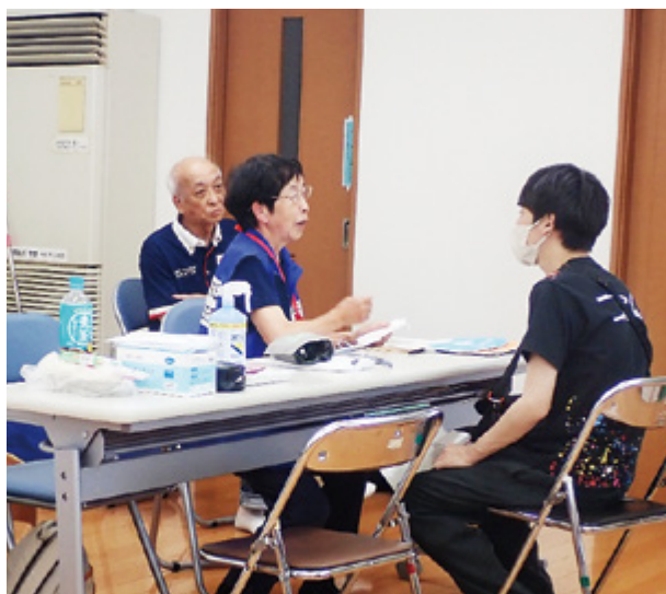
〈双葉地区自治会館に救護所を開設〉