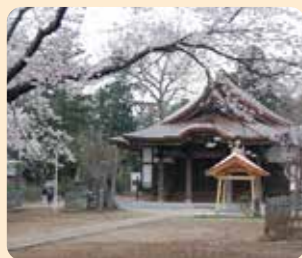
千姫の墓所 弘経寺