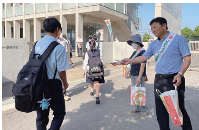
水海道一高での啓発活動の様子