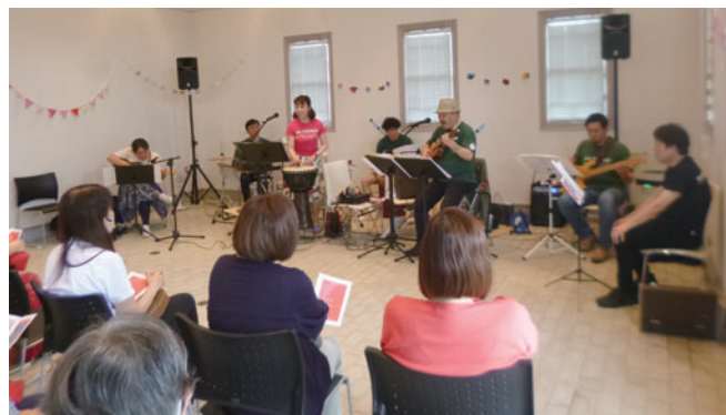
本格的な歌と演奏で観客を魅了したlele Cosmosコンサート

開演後も観客の皆さんと楽しそうに談笑するlele Cosmosの皆さんの姿が印象的でした。