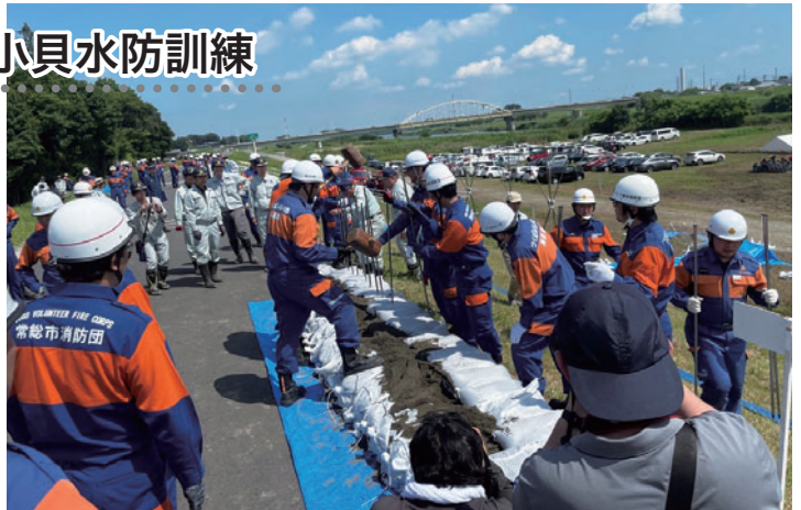
県職員の指導を受け、積み土のうを実施する団員たち

訓練では、所属市町を問わず、協力して作業を行い、水防活動に対する意識が高まりました。