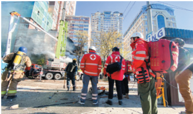
▲首都キーウで攻撃のなか、24時間体制で対応する緊急対応チーム

日本赤十字社は、資金援助に加え、ウクライナや周辺国に職員を派遣し、現地のニーズに対応した支援活動を展開しています。