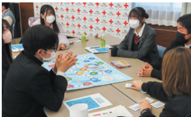
▲SDGsについて学ぶ高校生メンバー

本県では、350校、約66,000人のメンバーが、校外での清掃活動、慰問、募金活動等の活動を通して、赤十字の心を育んでいます。