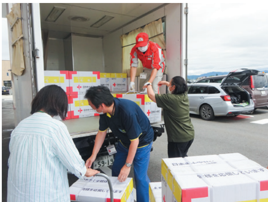
▲【令和4年8月大雨災害】救援物資を被災地に届ける日赤職員