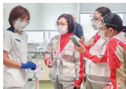
▲医療支援を行う日赤職員