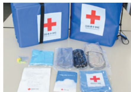
▲避難所生活に必要な救援物資(マット等)