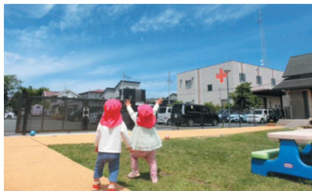
▲しゃぼん玉を追いかける乳幼児

また、乳児院では、子どもたちと一緒に遊び、授乳や離乳食を介助するボランティアが活躍しています。