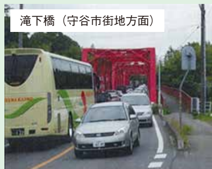
滝下橋（守谷市街地方面）