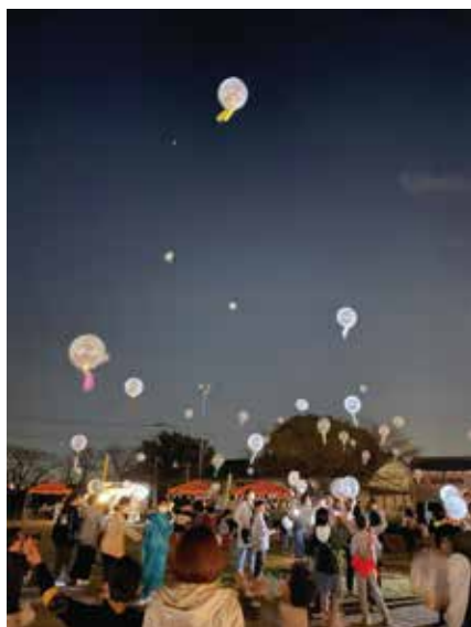
ありがとう大花羽小学校2022の様子

子どもたちが一番喜ぶ内容にしたいというのが強かったので、夜空に希望を乗せて飛ばすバルーンリリースです。バルーンは火が使えないのでヘリウムガスでしたが、入手するのが困難でそろえるのが大変でした。バルーンは中にLEDの照明を入れて、子どもたちが短冊に願いや希望などを書いて夜空に飛ばしました。ただし、飛ばしたままにできないので、紐をつけて回収できるようにして、