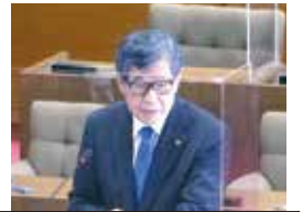
堀越 道男 議員