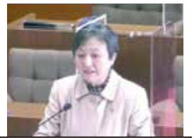
遠藤 章江 議員