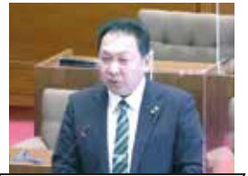
大澤 清 議員