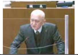
岡野 一男 議員