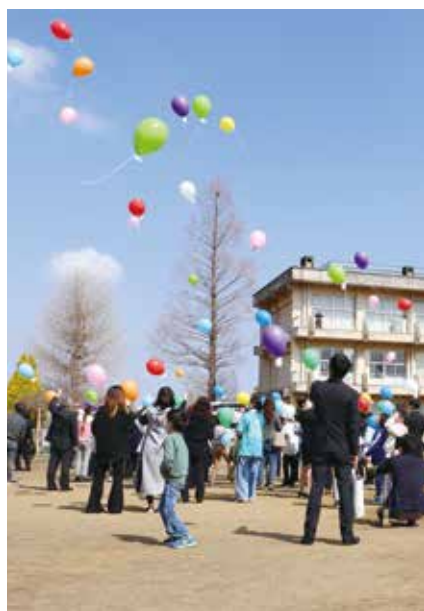
小学校への感謝とそれぞれの未来への飛躍を願い「バルーンリリース」