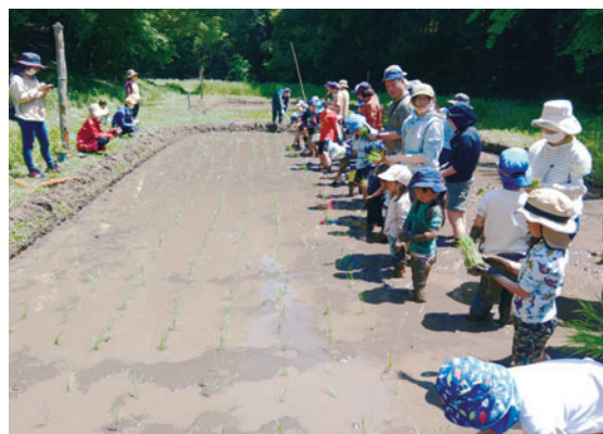
晴天の下、田植えを体験する参加者

里山はいきものの宝庫。観察しながら、みんなで育てた稲は9月に昔ながらの農機具を用いて脱穀します。秋は田んぼでお米パーティを行う予定です。