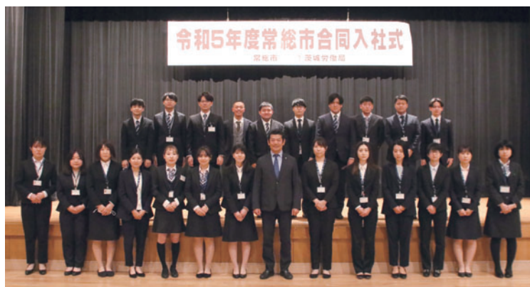
合同入社式に参加し、社会人としての一歩を踏み出した皆さん