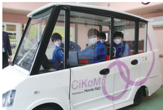
技術実証実験車両（サイコマ）に乗車する中学生たち

講師には市職員のほか、本田技術研究所の社員も迎え、AIや自動運転などの最先端の研究について学びました。講演終了後は本田技術研究所が市内での技術実証実験で実際に使用している車両を見学し、生徒たちは興味津々な様子でした。生徒からは「自動運転が当たり前になると考えると、とてもわくわくする」「常総市の未来が楽しみになった」などの感想が寄せられており、科学技術への関心や未来への期待感の高まりがうかがえました。市では、今後もこのような学びの場を提供していきます。