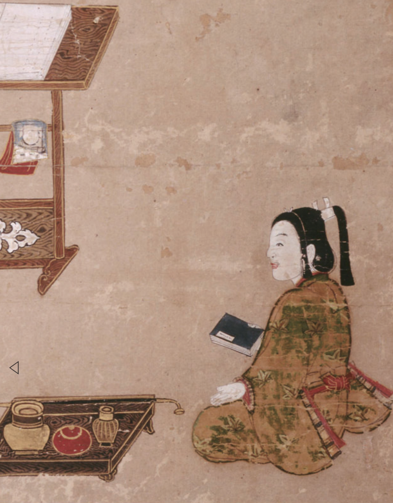
千姫姿絵（常総市指定文化財 弘経寺蔵）