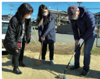
向石下介護予防教室でグラウンドゴルフ体験をする様子