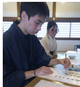
弘経寺において写経体験をする研修員