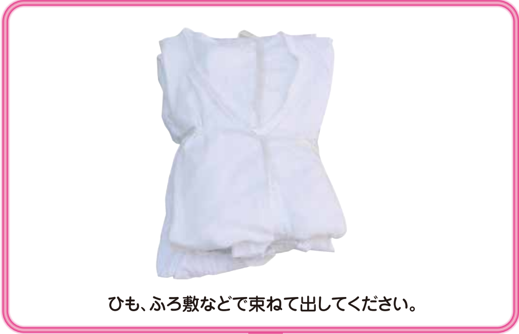
ひも、ふろ敷などで束ねて出してください。