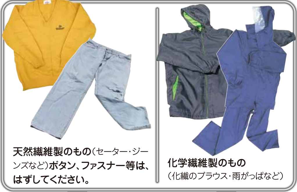
天然繊維製のもの(セーター・ジーンズなど)ボタン、ファスナー等は、はずしてください。