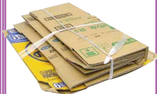
ひもで十文字にしぼる