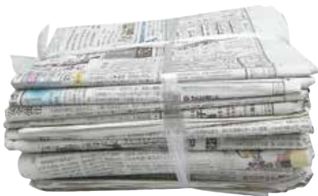
ひもで十文字にしぼる