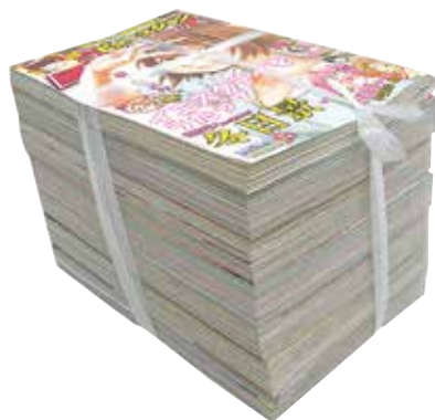
ひもで十文字にしぼる