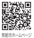
常総市ホームページ