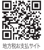
地方税お支払サイト

利用できるスマートフォンアプリやクレジットカードブランドなど、納付方法について、詳しくは「地方税お支払サイト」でご確認ください。