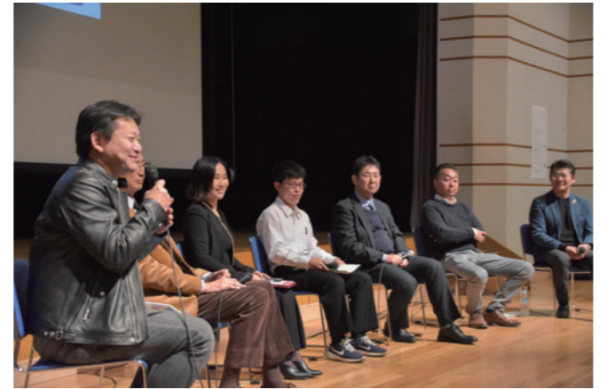
▲第2部は様々な意見が飛び交いました。

随時、参加者から質問を受け付け、パネラーがその質問に答えることで、参加者と交流を深めました。