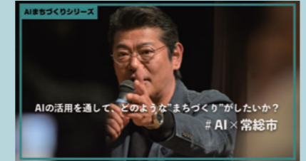
▲動画は分野ごとに別けて公開します。