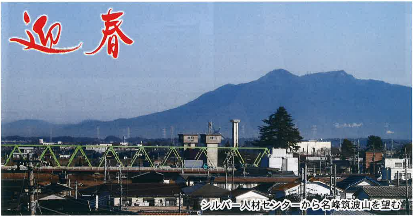
シルバー人材センターから名峰筑波山を望む