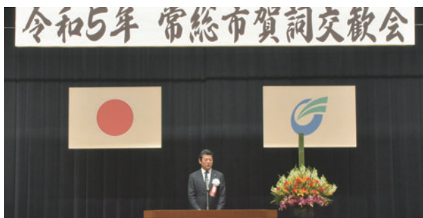
年頭のあいさつをする神達市長

主催者を代表してあいさつした神達市長は「アグリサイエンスバレー事業では、昨年12月に観光農園がオープンした。今春には道の駅「常総」がオープンを迎える。その後も、民間集客施設や都市公園の開業が続き、新たな常総市の玄関口として、市内外から多くの方々に来ていただけると期待している。また、ホンダ技術研究所と「AIまちづくりに向けた技術実証実験に関する協定」を結んだ。今後、あすなろの里やアグリサイエンスバレーをフィールドとして提供し、知能化マイクロモビリティの技術実証実験に協力し、新たなまちづくりの可能性を考えていきたい」と抱負を述べました。