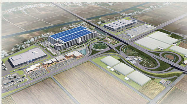
アグリサイエンスバレー常総

アグリサイエンスバレーのようなすばらしい施設がもっと色々な場所にできてほしいと思い「アグリサイエンスバレー」の最後に地名をつける形で「アグリサイエンスバレー常総」にしました。