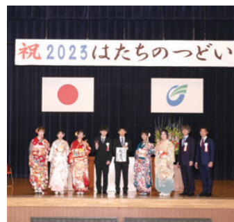
午前の部と午後の部の実行委員の皆さん