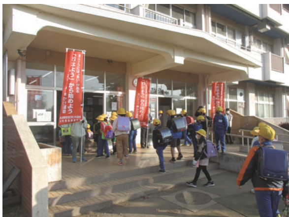
菅原小に大花羽小児童が訪問し、行った あいさつ運動