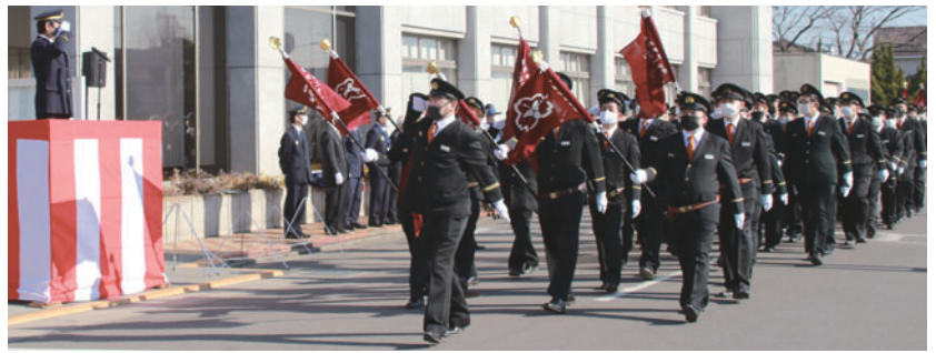
分列行進と 一斉放水の様子

参加した消防団員・消防職員全員が、地域防災の要であることを再認識するとともに、火災・災害のない安全な年であるように願いました。