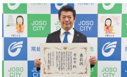
表彰状を持つ神達市長

今後も、交通事故のない安全安心なまちを目指し、関係団体や市民と一体となった交通安全運動を進めていきます。