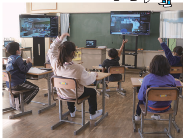
大花羽小で菅原小の授業にオンラインで参加