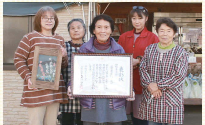
功績者表彰(団体)を受賞した石下農産物直売所の皆さん

全会員が女性で、直売所には会員自ら作った農産物や農産加工品が並び、地産地消にも貢献しているほか、年1回行われる周年記念祭を通して、地域の消費者と交流を図るなど、生産した農産物と加工品の販売を通して、農村女性による消費者交流や地域活性化に寄与されています。