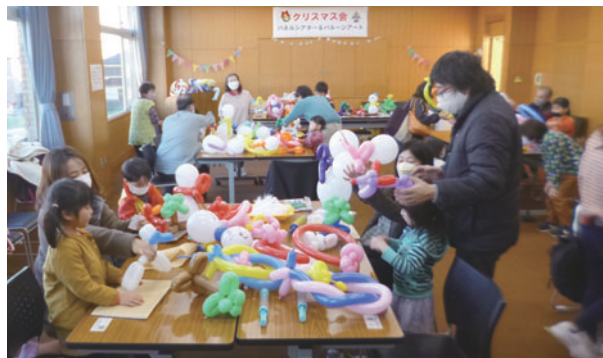
バルーンアート作りを楽しむ参加者