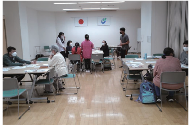
日本語講座で勉強する外国人の皆さん