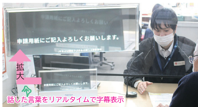
透明ディスプレイを試験設置したときの様子