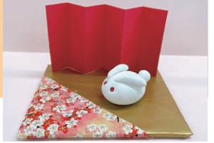
☆秋・冬の手芸はお正月の干支飾りを製作します。

《時間》おおむね 90 分 《講師》保健師、管理栄養士、健康運動指導士等 《持ち物》水分・タオル・老眼鏡（必要な方）・マスク