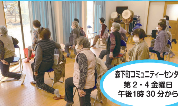
森下町コミュニティセンター 第2・4金曜日 午後1時30分から

介護予防推進員（ボランティア）が主催している教室のご紹介です。 皆さんがお住まいの地区で週1回～月1回開催されています。地区によって活動内容は様々。 体操やレクリエーション、手芸、お茶飲みなど…皆さん楽しく活動されています。