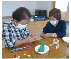
☆手芸をしている様子です。体操以外にもみんなで楽しめる活動をします♪

いきいき教室 身体を動かす「関節痛予防体操」、頭を動かす「脳のトレーニング」、生活と身体の講話、レクリエーションや手芸・工作などを行います