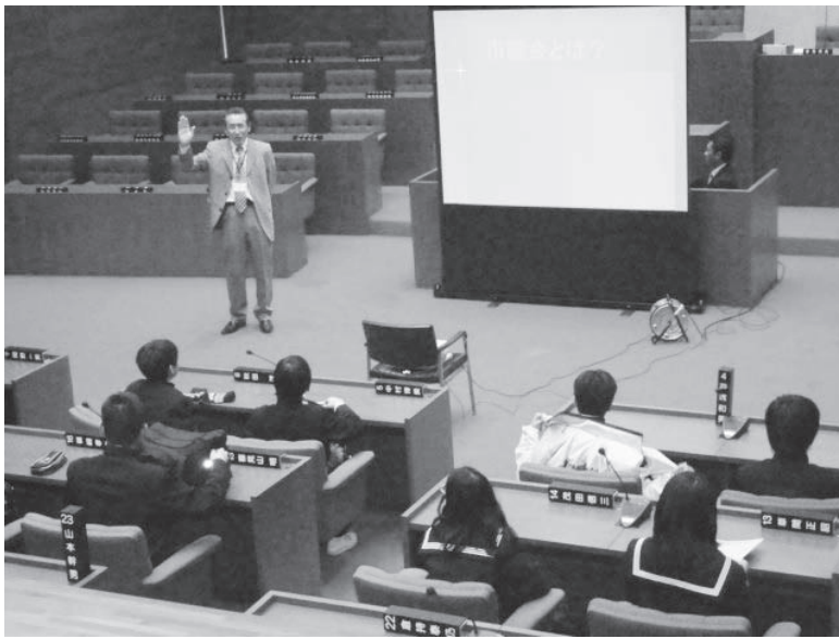
家庭教育学級（市議会議場）

平成22年12月16日、市議会議場で水海道中学校の1年生の皆さんによる家庭教育学級が開催されました。テーマは「私たちの常総市をもっと知ろう」です。生徒達は議員席に座ることができて大いに感動した様子でした。市役所ではフィルムコミッションや組織、各課の仕事内容、市議会の政策決定に関する