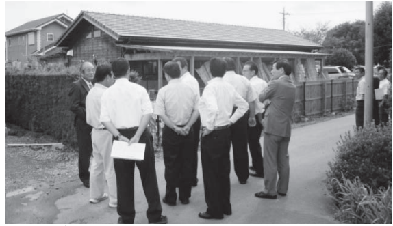
(有)ブラウンシュガー現地調査（菅生町地内）