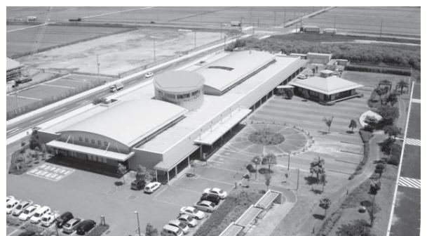
教育委員会がある総合福祉センター