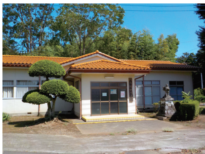
現在の内守谷公民館