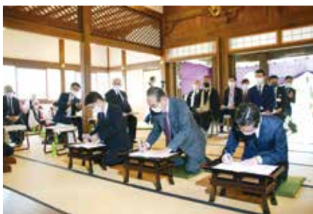
千姫様の菩提寺「弘経寺」にて 三市の議長が参加確認書に署名