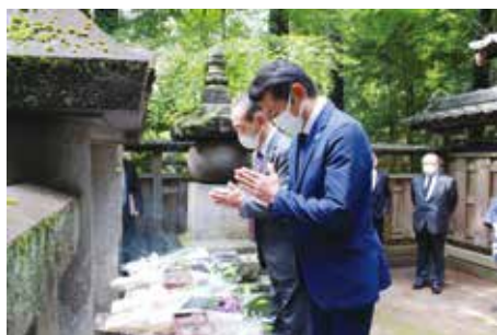
墓前で手を合わせる 常総市議会議員と常総市長