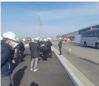
事業地内「株式会社ムロオ」前

令和3年12月16日アグリサイエンスバレー事業について、議員有志による現地視察を行い、現在の工事の進捗状況などの説明を受けました。