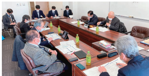
文教厚生委員会の様子

文教厚生委員会では、今回の調査において保護者の皆様のご意見や検討委員会の協議状況、今後のスケジュールなどを確認しました。学校教育・地域に果たす役割として非常に重要な問題であるため、今後も注視していきたいと思っております。