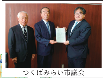
つくばみらい市議会

令和3年11月26日、「水海道有料道路時間帯無料措置への協力に関する要望書」を坂東市議会、つくばみらい市議会へ提出しました。今後も水海道有料道路時間帯無料措置を継続していくため、特段のご支援とご協力を賜りますようお願いをいたしました。