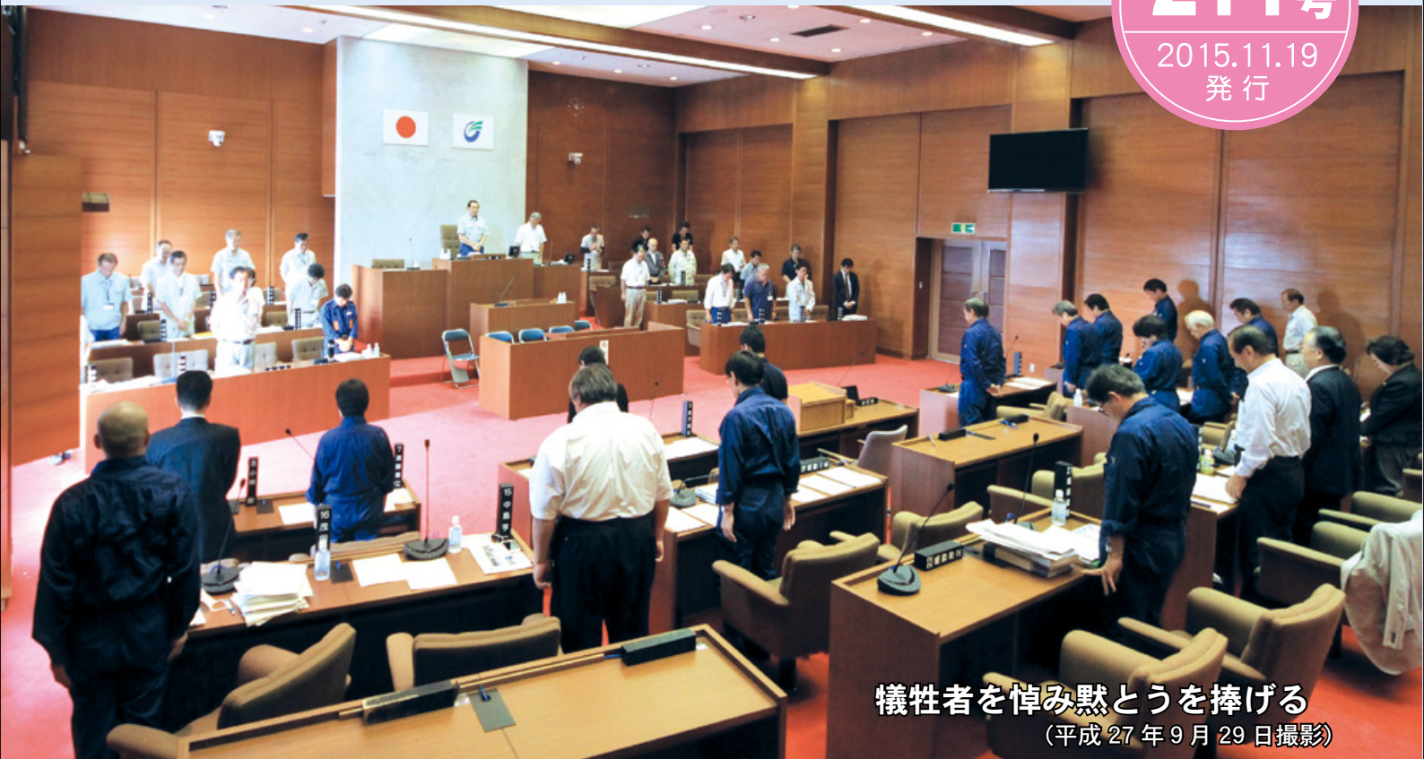
犠牲者を悼み黙とうを捧げる (平成27年9月29日撮影)