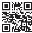
全国国民年金基金HP

◆掛金は全額、国民年金保険料と同様に、社会保険料控除の対象となり、年末調整や確定申告で所得税や住民税の軽減を受けることができます。