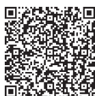
特定健診 後期高齢者医療制度健診

その他 集団健診・ドック検診や勤務先での健診などで今年度すでにお受けになった健診・検診項目は重複して受診できません。協力医療機関や健診料金などの詳細は、2021年度常総市健康カレンダーP16～P20(二次元コード)でご確認ください。