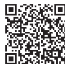
キャンセル待ち 登録者募集