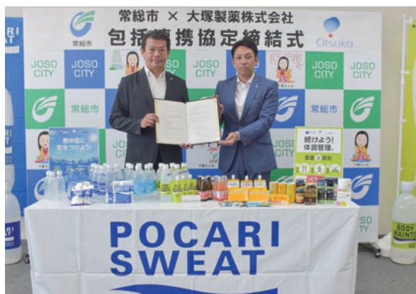
協定を締結した平内大宮支店長(右)と神達市長