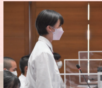
◀答弁を受けて再質問をする様子