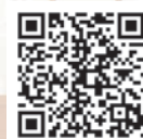
インターネット議会中継