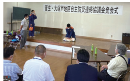
▲絹西出張所員から救急応急処置の説明を受ける参加者

常住人口のうごき(令和4年8月1日現在)※( )内は前月比 男30,132人(-8)/女29,900人(-1)/合計60,032人(-9) 外国籍住民5,902人(+61)/世帯数22,965世帯(+56)