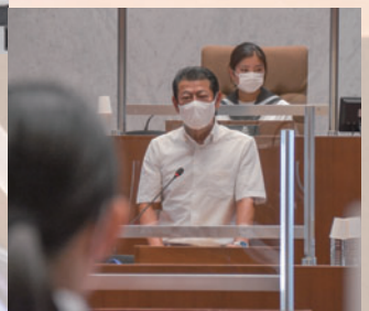
再質問に回答する神達市長▶