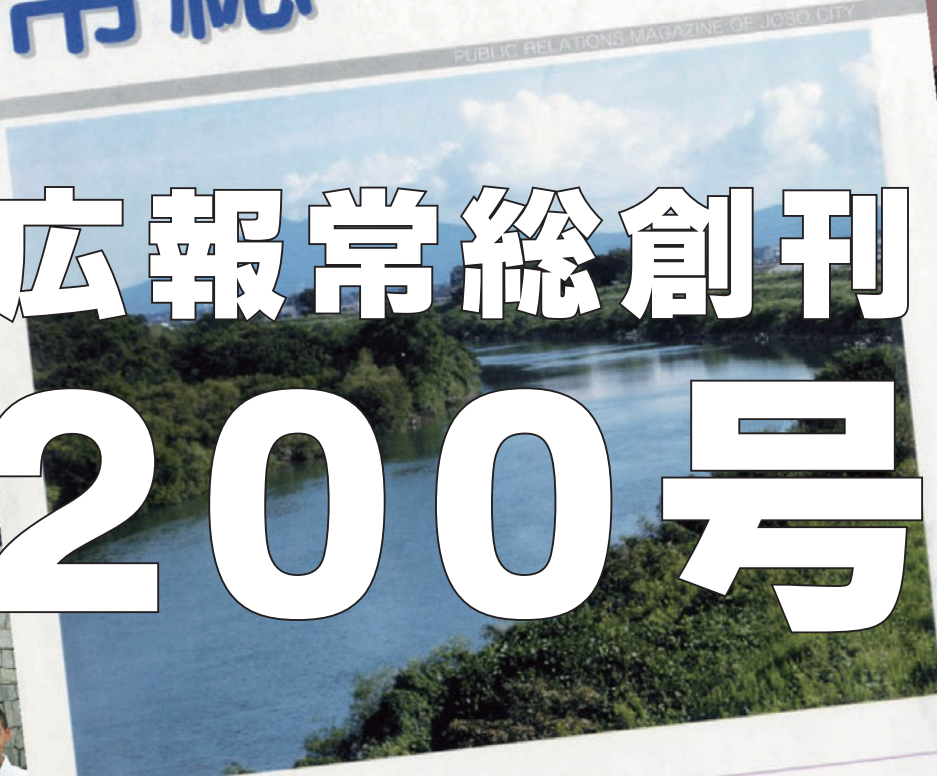
常総市から望む鬼怒川と筑波山