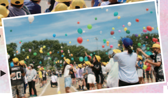
▶一斉に風船を飛ばす児童たち