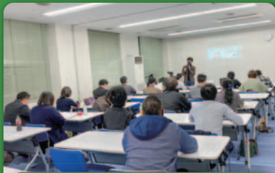
事業づくりを学ぶ講義

昨年度は、本講座第1期生の4つのグループから、新しい事業アイデアが生まれました。この事業構想の実現に向けてあなたも仲間に加わりませんか? また、参加された第2期生の新しい事業構想づくりも支援していきます。