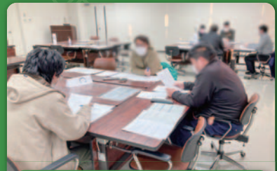
講座内・講座外でのグループワーク