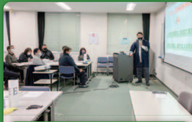
ゲスト講師による講演