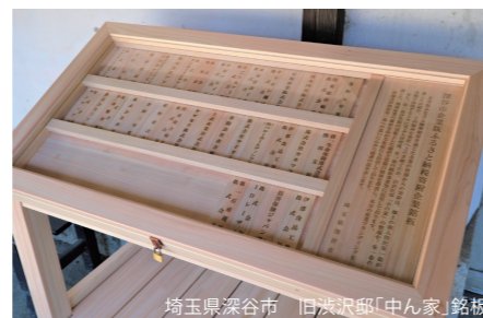
埼玉県深谷市 「旧深谷邸「中ん家」銘板