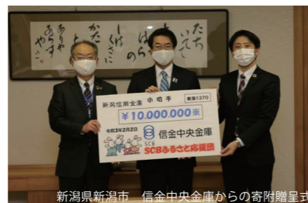
新潟県新潟市 信金中央金庫からの寄附贈呈式

※上記はあくまでも一例であり、企業側から寄附先の地方公共団体を募集する場合や、企業が寄附活用事業の立案段階から参画する場合があります。