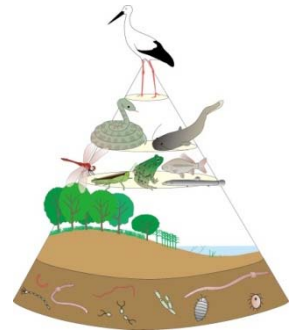
水辺の生態系ピラミッド

野田市の生物多様性だけでなく、多くの地域・主体と連携をはかることによる、江戸川、利根川、利根運河の各流域、さらには渡良瀬遊水地や印旛沼・荒川といった 関東広域における水辺エコロジカル・ネットワークの形成 へとつなげていきます。