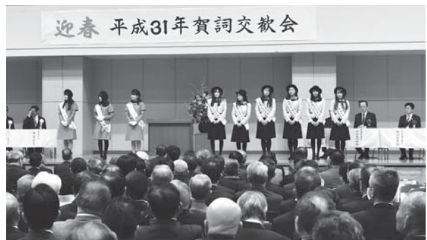
今年の賀詞交歓会の様子