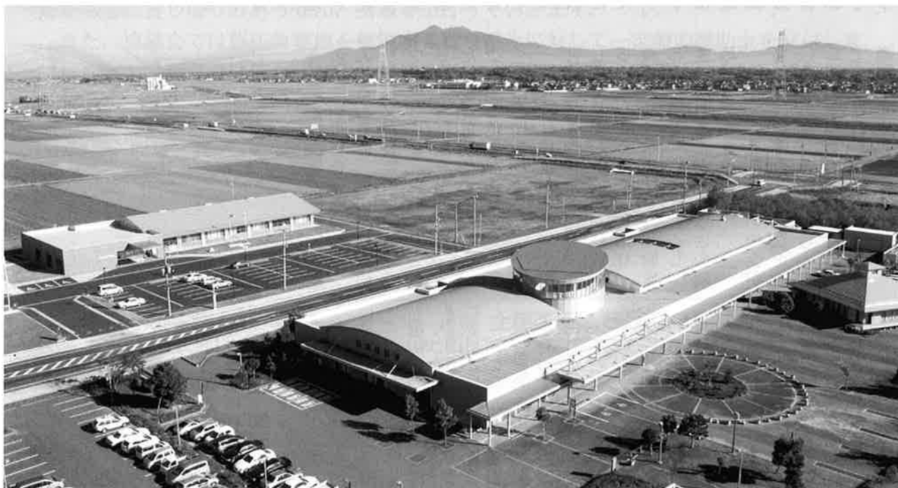
地域交流センターから、石下庁舎・石下総合福祉センターと筑波山を望む