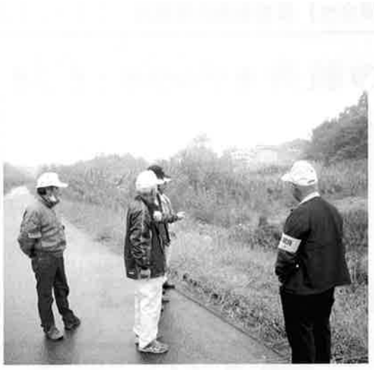
農業委員による農地パトロール！