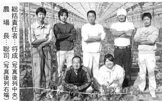
新入社員のみならず(石下農場にて)