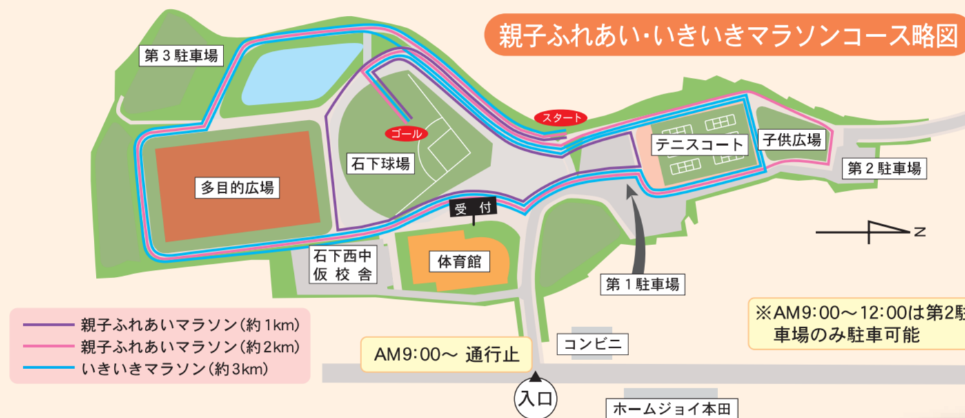
親子ふれあい・いきいきマラソンコース略図