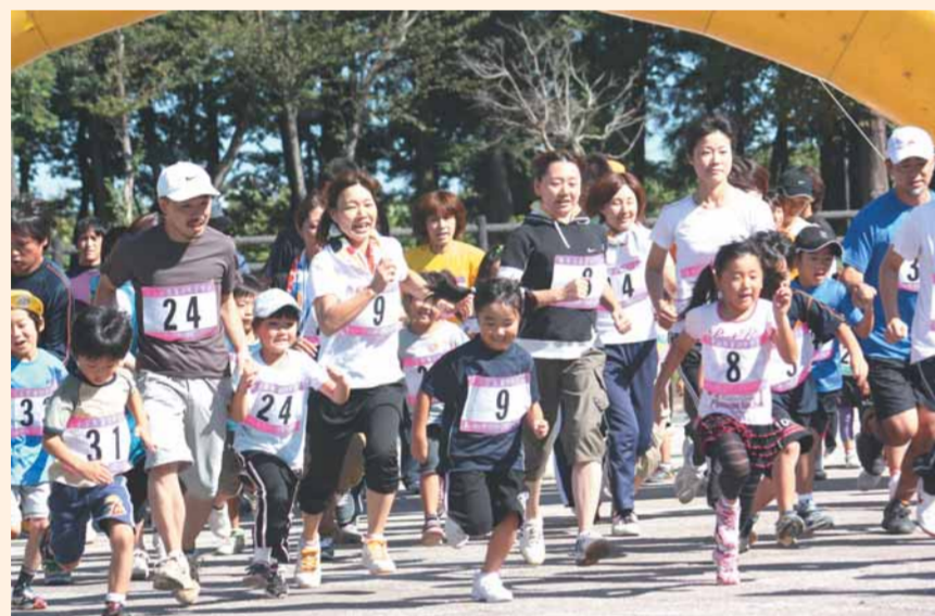
親子ふれあいマラソン