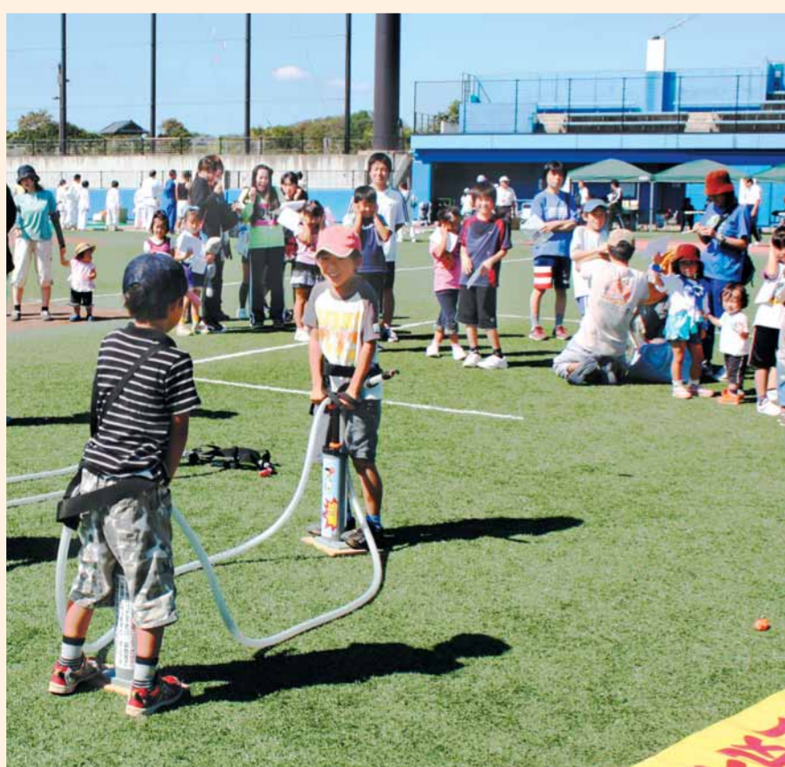
空気早入れ選手権