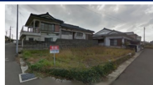
鹿児島県いちき串木野市(土地) 譲渡額約350万円