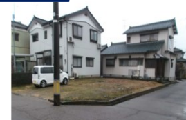
新潟県燕市(土地) 譲渡額約350万円