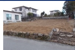
三重県津市(土地) 譲渡額約270万円